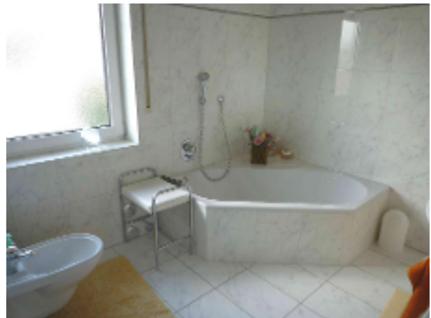
Bad mit Wanne...