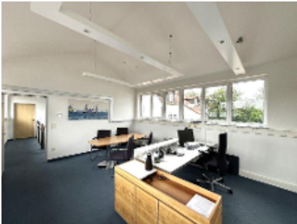
Büro 8 OG