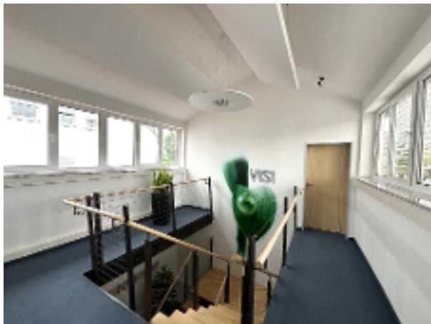
Zugang Büro 7 OG