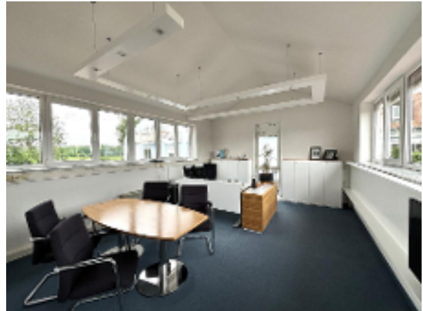
...Büro 8 OG