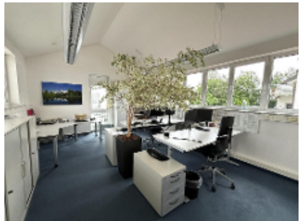
Büro 6 OG