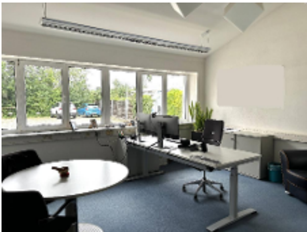
Büro 1 EG