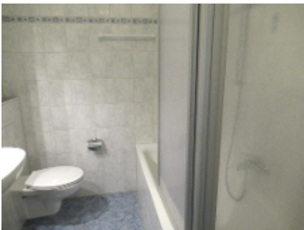
Bad mit Wanne und...