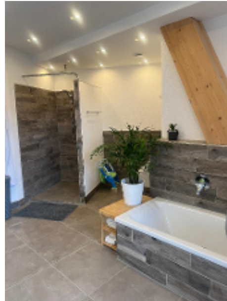
...Wanne u. Dusche